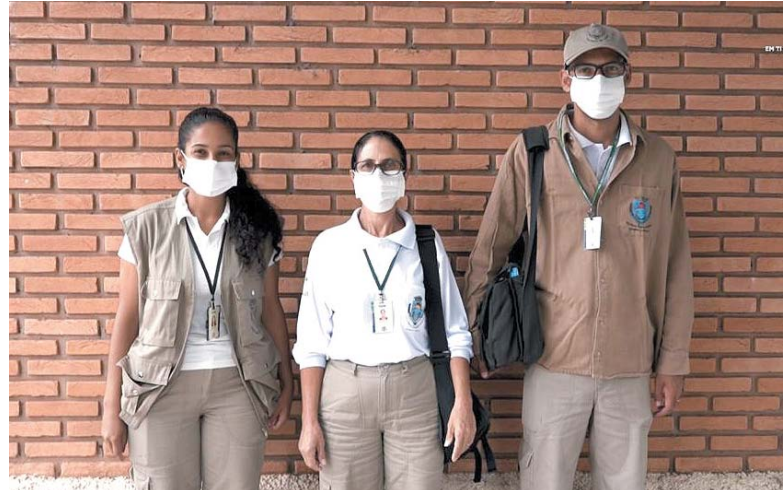
A recomendação é para que as pessoas atentem ao uniforme dos agentes que estão visitando as casas