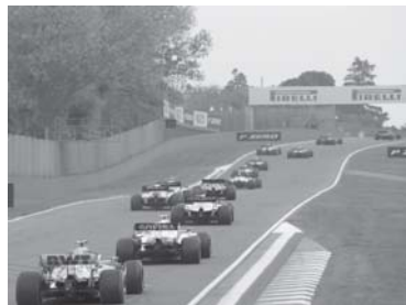
O Circuito de Imola foi inserido ao calendário da F1 no ano passado e ganhou nova vaga em 2021

A maior dúvida do momento é o que fazer com o GP da China que seria disputado em 11 de abril, mas os organizadores pedem para que a corrida seja realizada mais no final do campeonato. A China é um mercado importante para a F1 e todo o esforço será feito para encontrar um encaixe. O problema é que com o campeonato começando agora, no Bahrein, dia 28 de março, e não mais dia 21, na Austrália, a maioria das outras provas também sofreu alterações de datas e a última perna ficou apertada com três corridas seguidas: México,