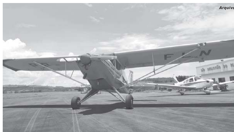
De frente ao avião de instrução de voo da marca Aero Boero e ao fundo o avião da marca Tupi, também de instrução de voo, ambos pertencem ao Aero Clube de Paraíso