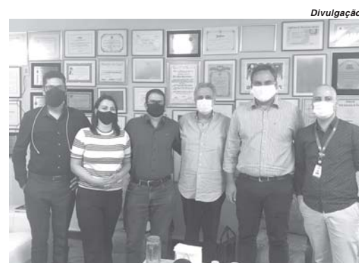
Representantes regionais do Sebrae participaram de encontro realizado em Paraíso