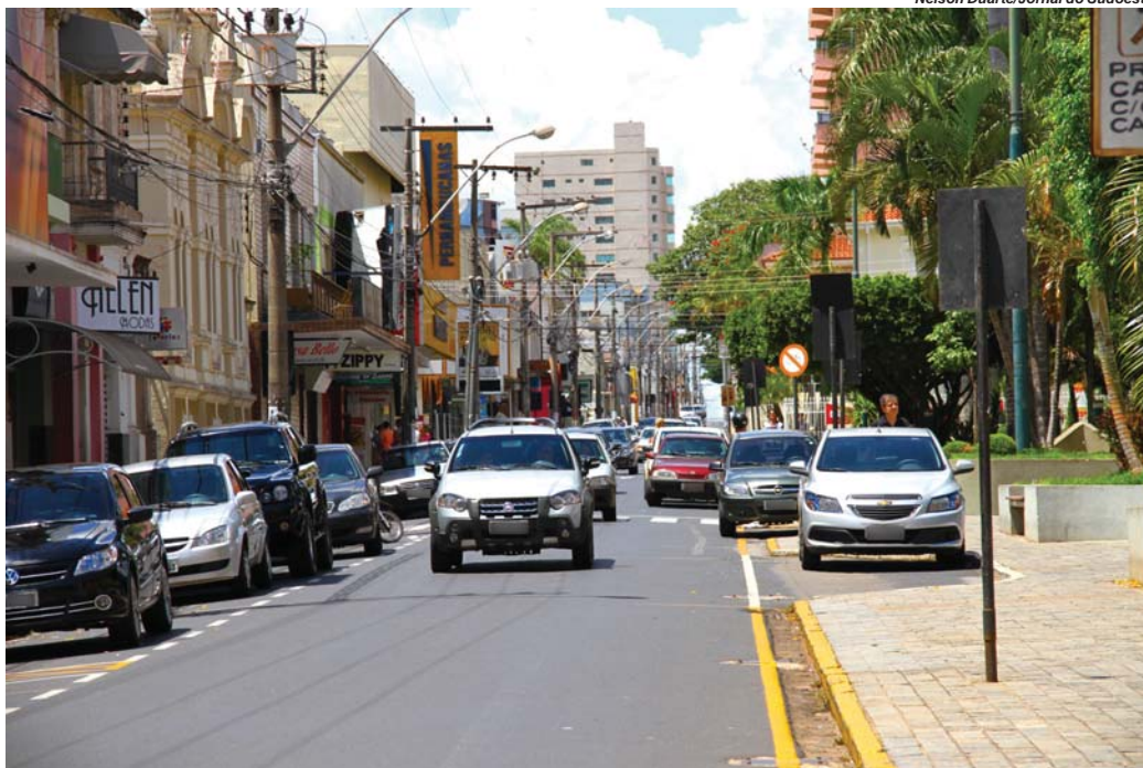
Nelson Duarte/Jornal do Sudoeste