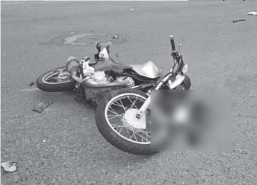
Motocicleta Honda utilizada pela vítima de 22 anos caída sobre o asfalto após a colisão

De acordo com informações repassadas pelos Bombeiros, a jovem seguia em uma motocicleta Honda por uma das vias paralelas que dão acesso ao Fórum, no residencial California Garden. Ao parar em um cruzamento sinalizado com placa de “Pare”, a moto foi atingida na traseira