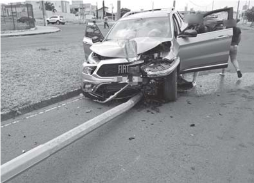
Frente da Fiat Toro destruída depois da batida contra o poste, que foi arrancado e ficou caído na pista

Vítima foi socorrida pelo Corpo de Bombeiros e levada à UPA; caminhonete derrubou poste e parou em canteiro central