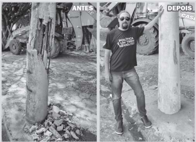
Poste substituído na avenida Benevenuto Candiane bairro San Genaro

Essas medidas improvisadas passaram a ser alvo de questionamentos sobre a garantia da segurança pública, uma vez que estruturas