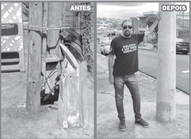
Postes substituído na rua Maria Abadia Amaral Malagute com a rua São Francisco