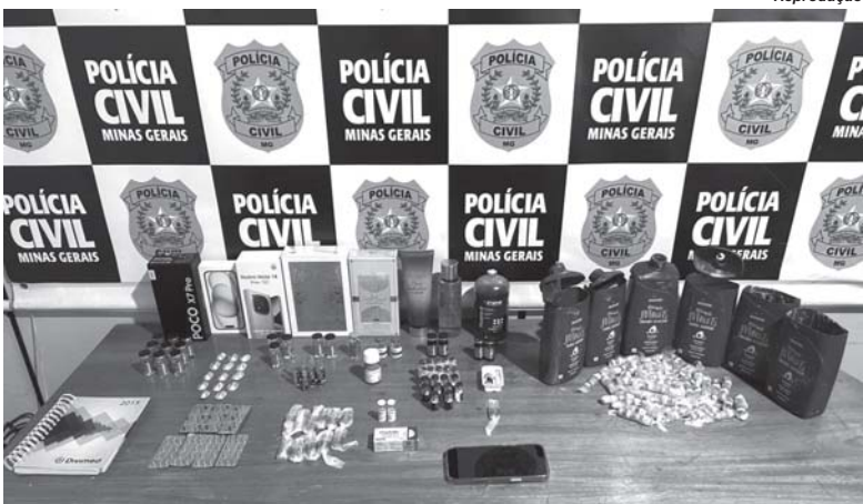
Produtos foram encontrados no carro e na residência do suspeito, que foi preso em flagrante

Na sequência da prisão, os investigadores realizaram buscas na residência do homem. No local, foram encontrados