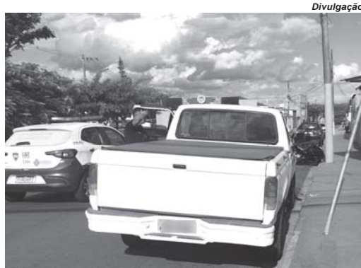
Caminhonete conduzida pelo motorista embriagado subiu na calçada e encostou em poste de sinalização na Avenida Wenceslau Brás

Durante patrulhamento guardas municipais localizaram o veículo — uma caminhonete Ford F1000 branca — no momento em que o condutor tentava estacionar em