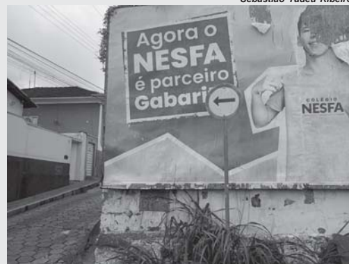
Placas de sinalização "sentido único" colocadas em locais inadequados, confundem condutores

Existem várias destas placas em cruzamento de vias públicas de Paraíso, como exemplo, a que fica no cruzamento da Rua Capitão Pádua com a Rua dos Antunes, centro. A Rua Capitão Pádua é mão única, com início na Av. Dr. Delfim Moreira fazendo cruza-