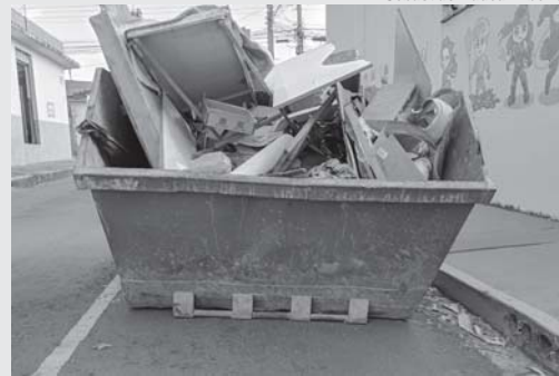
Caçambas sem as fitas refletivas ainda existem nas vias públicas de Paraíso

O serviço que presta essas caçambas é essencial para manter as cidades limpas e evitar entupimento de bueiros. O único problema que podem acarretar é alagamentos que estão espalhados por vias públicas não terem fixado em suas laterais, frente e fundo, aquelas necessárias fitas adesivas re-