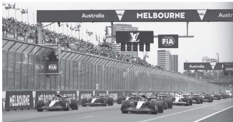
GP da Austrália tem a classificação nesta madrugada de sexta para sábado às 2h e a largada à 1h de sábado para domingo

F1 tem a volta do Grupo Globo nas transmissões, 11 equipes, 22 pilotos, entre eles o brasileiro Gabriel Bortoletto na Audi