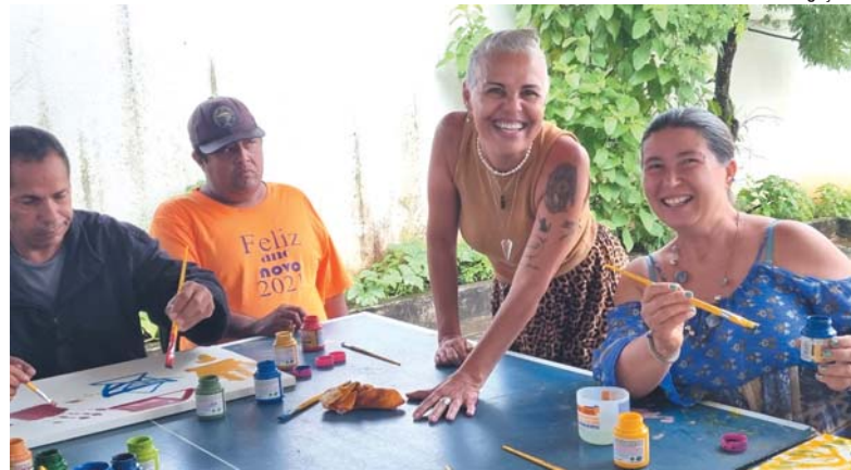
Ex-paciente agora é voluntária no cuidado às pessoas que precisam de apoio psicossocial

Prefeitura apresenta projeto de Centro Especializado em Saúde e Educação para Neurodivergentes e Ambulatório de Especialidades