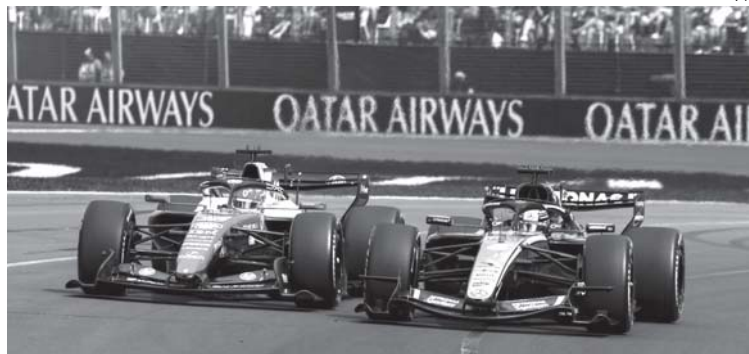
Leclerc e Russell trocaram 7 vezes de posição nas dez primeiras voltas, mas só por conta da falta, e recuperação, de energia das baterias

Embora a F1 comemore 120 ultrapassagens, a maioria delas foi do tipo "gato e rato" por conta do regulamento de motores que tornou as ultrapassagens artificiais