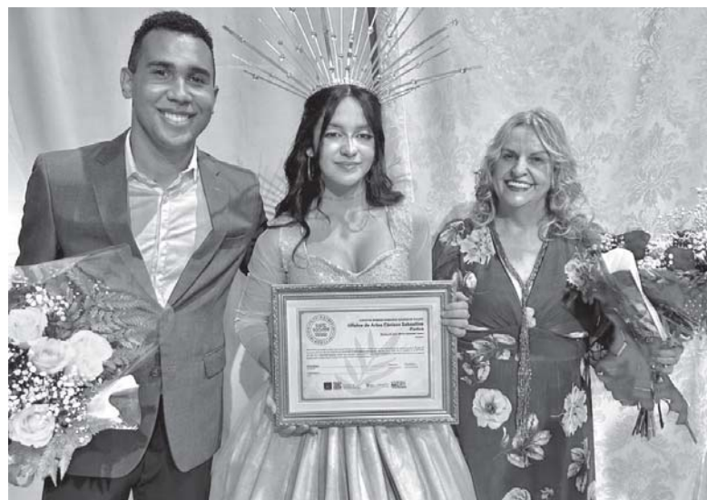
Integrantes da Oficina de Artes Cênicas Sebastião Furlan exibem o certificado de Ponto de Cultura