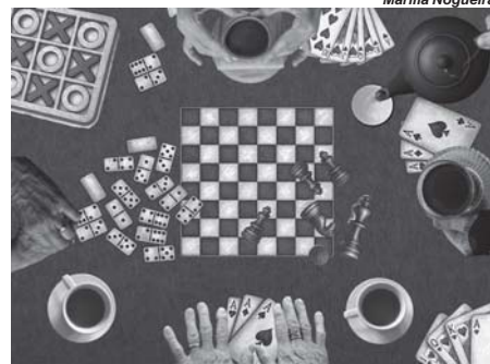
Colagem baralho é só pretexto

"Você não vai lá pra jogar baralho", disse para minha mãe.