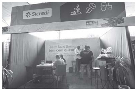
Na Fetec Agro, Sicredi apresenta soluções financeiras para fortalecer o agronegócio regional

Com um portfólio de mais de 300 produtos e soluções, o Sicredi atende seus associados com crédito, investimentos, seguros e uma gama completa de serviços financeiros.