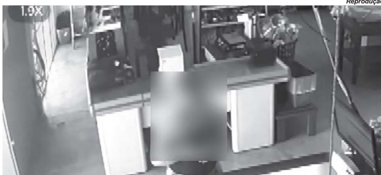
Mulher que ateu fogo em jovem é flagrada por câmera de segurança, mas ainda não foi identificada pela polícia

Depois de ser atingida, a vítima conseguiu sair do estabelecimento e pedir ajuda. Vizinhos prestaram os primeiros socorros até a chegada da ambulância. Ela foi levada inicialmente para o hospital de Delfinópolis e, posteriormente, transferida para a unidade especializada em queimados da Santa Casa de Pa-