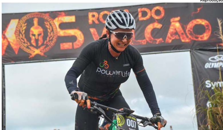
Ciclista de Paraíso cruza a linha de chegada e garante o título após dois dias de prova