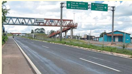
Passarela localizada na MGC 491, km 4

A indicação foi aprovada pelo plenário e encaminhada ao Executivo Municipal. Segundo o vereador, a situação é crítica e exige medidas capazes de ajudar a prevenir novas ocorrências em um ponto que há tempos preocupa moradores da região e usuários da rodovia.