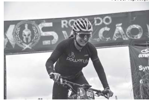
Ciclista de Paraíso cruza a linha de chegada e garante o título após dois dias de prova

A estratégia inicial, segundo ela, era apenas completar a prova. No entanto, o cenário foi mudando durante o percurso. Ao ser ultrapassada por adversárias, a ciclista decidiu respeitar o próprio ritmo e administrar a energia. Mais tar-