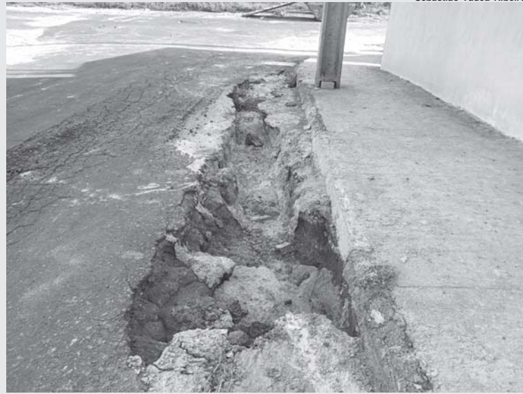
Enorme buraco na rua Mercedes Maria de Paula Venâncio, no Jardim São José, já está aproximando de um ano de existência